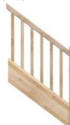
F1 Limon droit