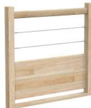
Bois / Câbles Soubassements en bois et câbles horizontaux Ø4 mm