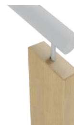
P120 Tête de poteau rectangulaire chanfreinée surmontée d'une main courante circulaire sur piton

Livré en kit à assembler avec talon à recouper de 40 mm (option : sans talon sur demande)