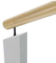
MCR P120 Ronde ø58 sur poteau de 120 x 70 mm