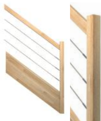
CHI Câbles horizontaux en inox Ø4 mm