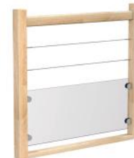
Verre stadip 44.2 / Câbles Soubassements en verre stadip 44.2 et câbles hori- zontaux Ø 4 mm