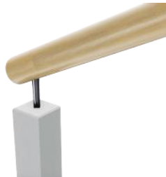
MCR P70 Ronde ø58 sur poteau de 70 x 70 mm