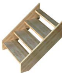
SCM Sans contremarche