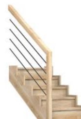
FC Limon façon crémaillère