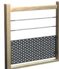
Tôle aluminium / Câbles Soubassements en tôle aluminium et câbles hori- zontaux Ø 4 mm