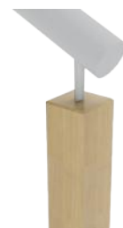
P70 Tête de poteau rectangulaire chanfreinée surmontée d'une main courante circulaire sur piton