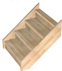
D1 Droite standard entre limons