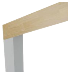
MCF Filante 70 mm avec 4 chanfreins 3 x 3 mm