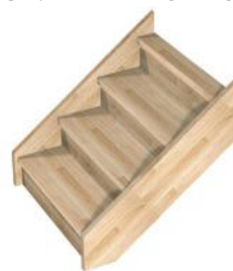
ACM Avec contremarches