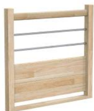
Bois / Tubes Soubassements en bois et lisses horizontales en inox ø16 mm ou acier thermolaqué ø20 mm teinte RAL au choix