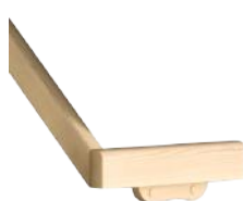
Prolongement de la main courante MC1 ou MC2 au départ et/ou à l'arrivée sur support