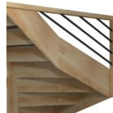
Remplissage BMHR Claustra horizontal en acier thermolaqué ø 20 mm teinte RAL au choix