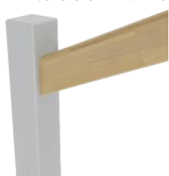
MC1 Droite 70 mm x 46 mm avec deux arrondis 12,5 mm