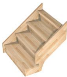
D2 Débordante devant poteau - simple ou double