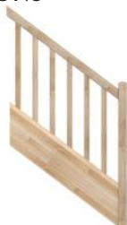
F1 Limon droit