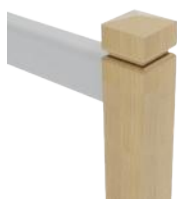
P2 Tête de poteau pointe de diamant à collerette