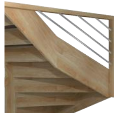
Remplissage BMHI Claustra horizontal en inox ø16 mm