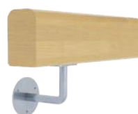
MC1 avec support en acier zingué Support main courante en acier zingué blanc côté extérieur et/ou côté intérieur (conforme norme PMR)