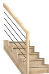
FC Limon façon crémaillère

Livré en kit à assembler avec talon à recouper de 40 mm (option : sans talon sur demande)