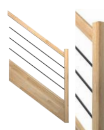
BMHR Lisses horizontales en acier thermolaqué ø20 mm teinte RAL au choix