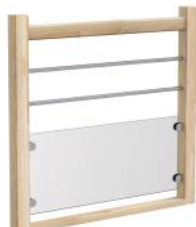
Verre stadip 44.2 / Tubes 16-20 mm Soubassements en verre stadip 44.2 et lisses horizontales en inox ø16 mm ou acier thermolaqué ø20 mm teinte RAL au choix