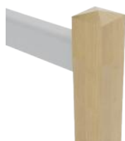
P1 Tête de poteau pointe de diamant