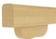
MC1 avec support bois Support main courante bois côté extérieur et/ou côté intérieur toutes essences (conforme norme PMR)