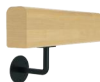
MC1 avec support en acier thermolaqué Support main courante en acier thermolaqué noir, blanc ou RAL côté extérieur et/ou côté intérieur (conforme norme PMR)