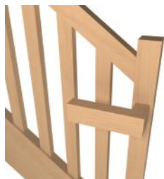
Débord à coupe d'onglet