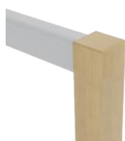
P3 Tête de poteau chanfreinée arasée à la main courante