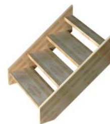
SCM Sans contremarche